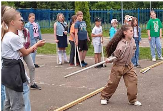
Игра в городки – очень увлекательная! И ребята из школьного лагеря с удовольствием в нее играли.

В школьном оздоровительном лагере «Солнечная страна» жизнь была яркой и интересной. Ребята отдохнули и провели с пользой свое солнечное лето. Участвовали в конкурсах и викторинах, состязались в спорте, общались с интересными людьми, ходили на экскурсии и принимали участие в интересных акциях.